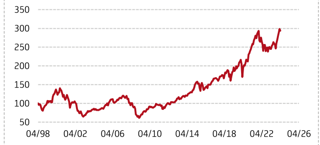
Wertentwicklung seit April 1998 in Euro (indiziert)