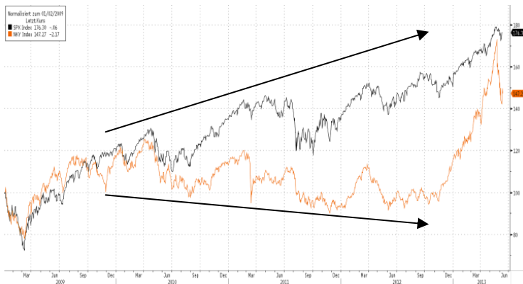
Die Wertentwicklung in der Vergangenheit ist kein verlässlicher Indikator für die zukünftige Entwicklung; Quelle: Bloomberg.