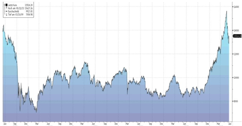
Die Wertentwicklung in der Vergangenheit ist kein verlässlicher Indikator für die zukünftige Entwicklung; Quelle: Bloomberg.