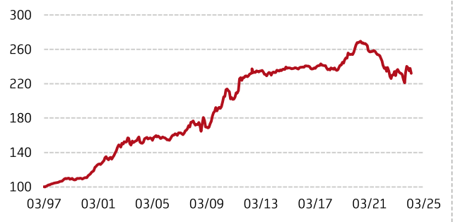
Wertentwicklung seit März 1997 in USD (indexiert)